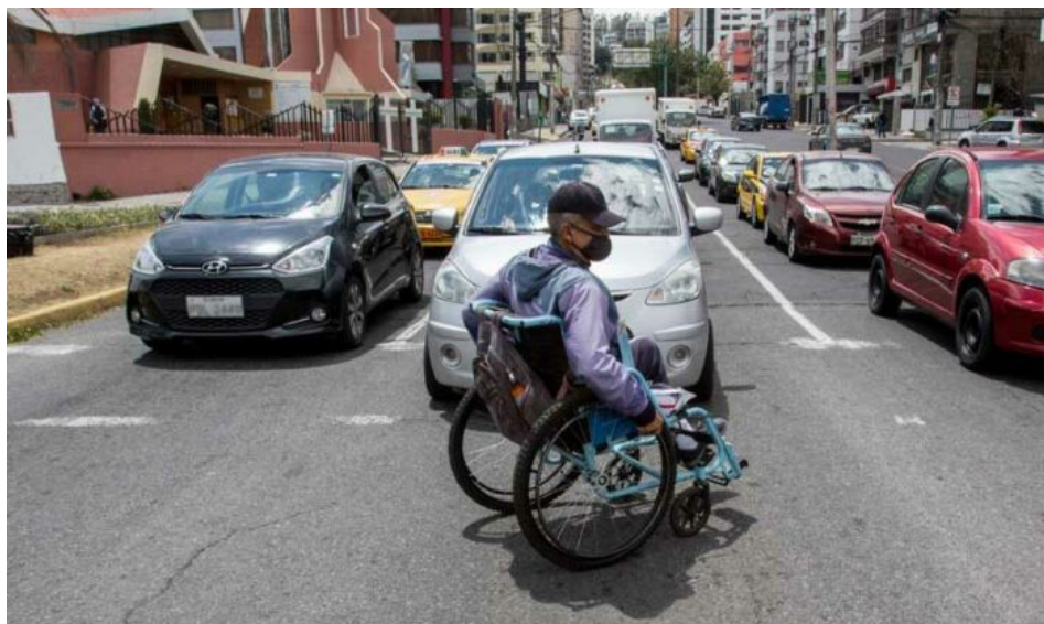
Gráfico 1. Las personas con discapacidad en Ecuador fueron excluidas del entorno laboral hasta la llegada de la Constitución del año 2008.