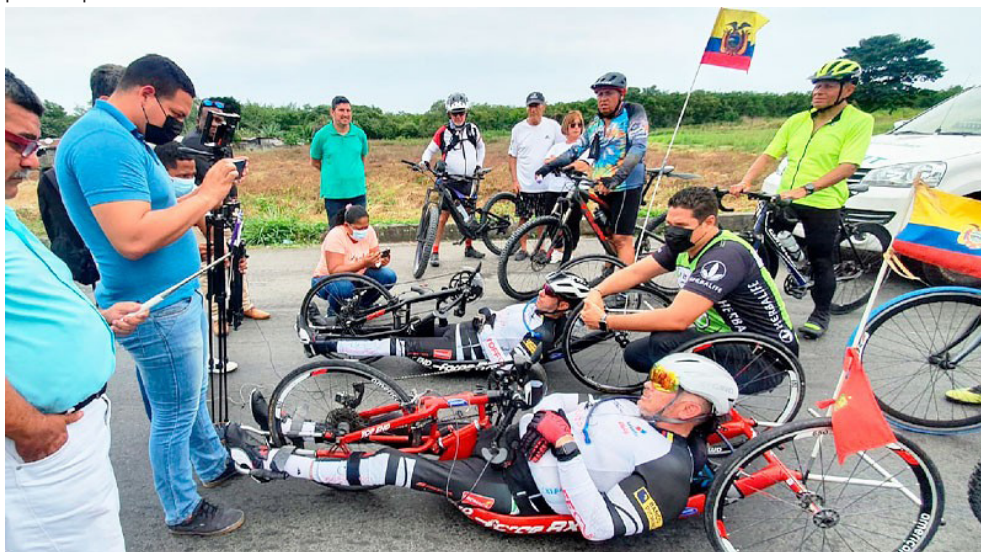
Gráfico 2. El deporte inclusivo y paralímpico es uno de los mecanismos de inclusión social incorporados a las políticas públicas en Ecuador.