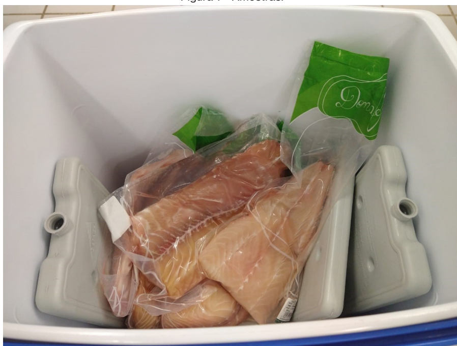
Figura 1 – Amostras.

Foram adquiridos filés de pintado amazônico ( Pseudoplatystoma fasciatum X Leiarius marmoratus ), frescos, com aproximadamente 500 gramas, diretamente do comércio, sendo encaminhados até o laboratório em caixas isotérmicas.