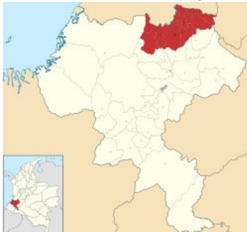
Imagen No 1: Localización del Norte del Cauca, respecto a Colombia.

El objetivo del presente trabajo fue comprender el impacto que tiene la cultura en la formación del Trabajador social del Norte del Cauca, el estudio se realiza bajo el enfoque cualitativo, utilizando las técnicas de las entrevistas a mas de 50 estudiantes, diálogos abiertos, visita en campo, y cartografías, lo que permitió reconocer que muchos de los estudiantes reconocen muy bien su contexto y pueden hacer ejercicios de problematizaciones sociales muy interesantes en su ejercicio de formación académica, sin embargo, el norte del cauca es tan diverso, se cuenta con comunidad afrocolombiana, indígena y campesina, lo que detona una variedad de cosmovisiones y saberes que son claves para comprender las interculturalidad existente. Lo interesante aquí, es que se plantean retos para la formación y el reconocimiento de la variedad y la posibilidad del intercambio cultural en la aprehensión de posibilidades de intervención teniendo en consideración no una monocultura presente en territorio, ni una identidad homogenea del Norte del Cauca, sino la comprensión de múltiples culturas presentes en este territorio que cuenta con una diversidad enorme que propicia pensar en la formación del futuro Trabajador Social, contemplando las plurirealidades y los modos otros de realizar investigación, intervención, desde el ejercicio profesional en los territorios.