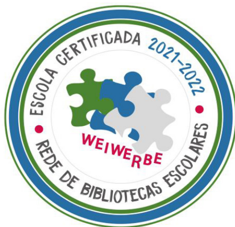
Figura 3 – Selo do WEIWE(R)BE.