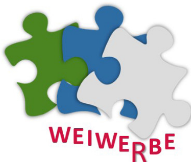
Figura 1 – Logótipo do Programa WEIWE(R)BE.