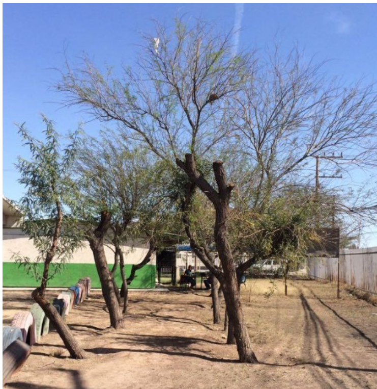
Figura 1: Escuela donde se obtuvo la materia prima para este proyecto.