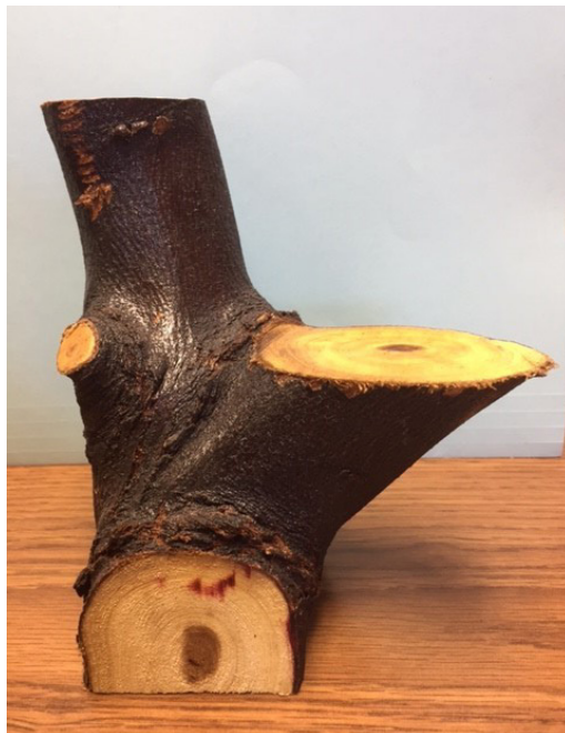
Figura 7: Detalles únicos y sencillos de un portaplumas.

estratégicos de los hogares con el fin de contar con un objeto bueno, bonito y barato (en México se dice con las 3 b´s), la figura 7 muestra los detalles (sencillos y a la vez bonitos) con los que cuenta un portaplumas; el color de la corteza, el corte y el barnizado le dan un toque único.