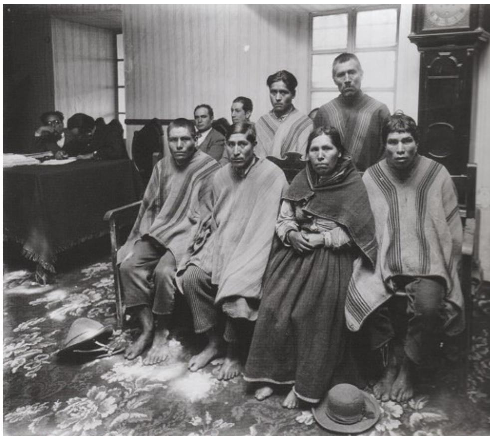
Fig. 3. Comuneros indios ante las autoridades por sus derechos.