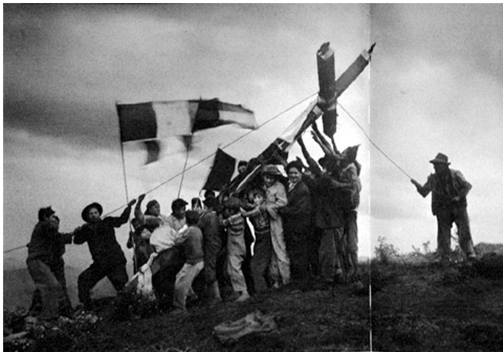
Fig. 2. Dos versiones de dos mundos entre la cruz y la patria 2014.

Las investigaciones sobre las diferentes posiciones ideológicas y sus propuestas programáticas políticas desde el indianismo y los intelectuales como Guillermo Carnero Hoke y Virgilio Roel Pineda indigenistas no es prolífera, por el contrario es reciente, en que el debate en cuestión cobra importancia en el escenario nacional dada la coyuntura política que se atraviesa.