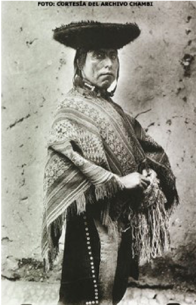
Fig. 4. Alcalde comunero o varayoc del Cuzco, autoridad no oficial.

La colectividad comunitaria de la indianidad es también propuesta de base en el indianismo de Carnero Hoke y de Roel. Y asumen tal doctrina y praxis revolucionaria de liberación desde el indio.