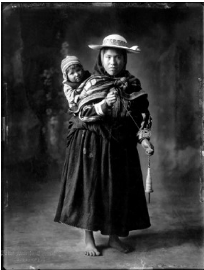
Fig. 5. Mujer y madre campesina indígena.

Efectivamente lo indio no es lo campesino, no lucha por un salario, lucha por la justicia social y su liberación mas campesino es una categoría económica. (Fig. 5)