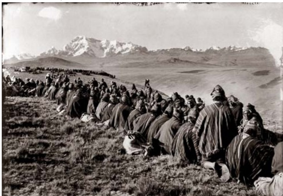
Fig.1. Comuneros cusqueños en asamblea, Cusco.

La educación colonial marcó notoriamente esa diferencia, así como status y privilegios, que a la postre en el tiempo se sintió en el mundo andino. Las Casas y M. Eyzaguirre, así como otros pensadores y oidores criollos como diputados americanos en las Cortes de Cádiz, se convirtieron en voceros y abogados de sus derechos negados dando inicio al indigenismo que estará presente en el siglo XX. (Fig. 1).