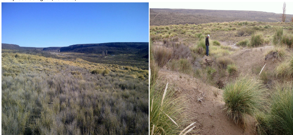
Figura 3. Terraplenado de la represa y vertiente natural.

Figura 2. Situación inicial del mallín/potrero en cercanías a la casa del campo (Izquierda) y lugar donde se realizó la represa de agua (Derecha).