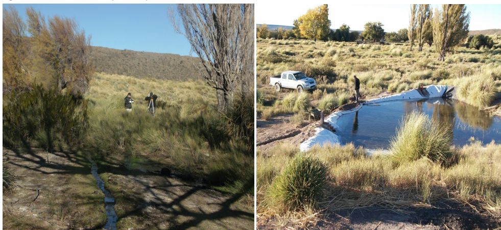
Figura 5. Medición del nivel del terreno con Teodolito para trazado de acequias (Izquierda). Represa completa de agua funcionando como prueba piloto (Derecha).

Una vez finalizada la etapa la represa, se procedió a llenarla de agua para consolidar la construcción de la misma y corroborar su funcionamiento (Figura 5 derecha). Se comenzó a realizar la traza de los canales principales tomando niveles de altura (Figura 5 izquierda) para ajustar su recorrido y distribución sobre toda la superficie del potrero (Figura 6).