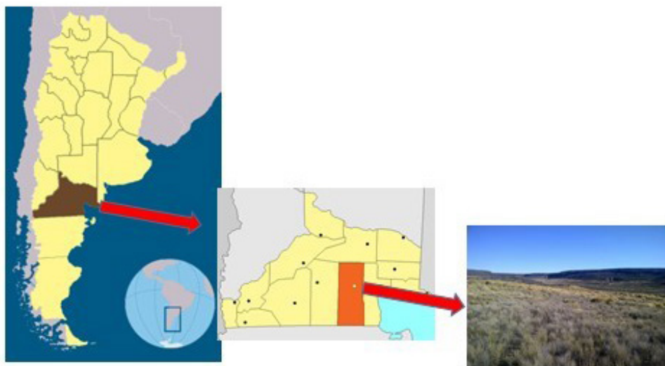
Figura 1. Ubicación geográfica del Dpto. Valcheta en la Pcia. de Río Negro. Argentina.

San Antonio, al Oeste con el Dpto. 9 de Julio y al Sur con la Meseta Sumuncura y Pcia. de Chubut (Figura 1). La ciudad cabecera es la localidad de Valcheta y en la misma se sitúan diferentes instituciones del estado municipal, provincial y nacional que interactúan entre sí en post del crecimiento y desarrollo de su población.