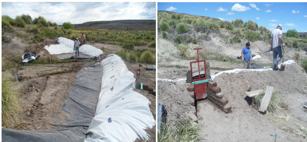
Figura 4. Impermeabilización de la represa (Izquierda). Construcción de compuertas en la represa (Derecha).

Una vez finalizada la etapa la represa, se procedió a llenarla de agua para consolidar la construcción de la misma y corroborar su funcionamiento (Figura 5 derecha). Se comenzó a realizar la traza de los canales principales tomando niveles de altura (Figura 5 izquierda) para ajustar su recorrido y distribución sobre toda la superficie del potrero (Figura 6).