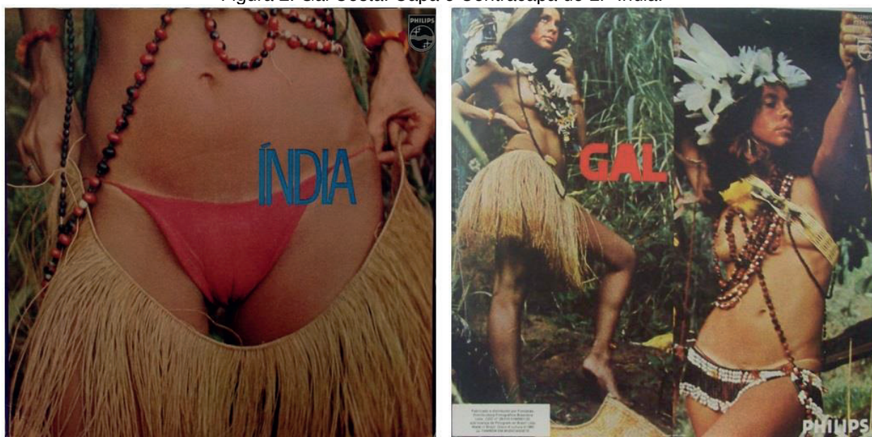
Figura 2. Gal Costa. Capa e Contracapa do LP Índia .

Talvez se possa afirmar, isso sim, que muitas dessas cantoras mais “populares” fossem até menos ousadas. Perla, na capa de seu LP de 1979 (Figura 3), com uma blusa aberta de cima abaixo , mostrava menos, sugeriria menos que Simone. 12