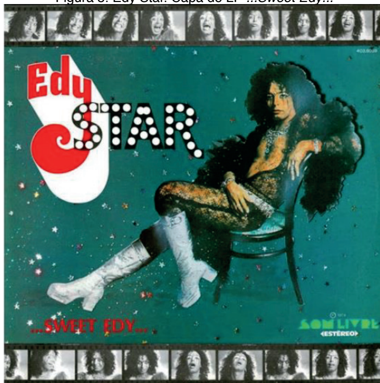
Figura 5. Edy Star. Capa do LP ...Sweet Edy...

Agnaldo Timóteo, em 1975, exaltou a “A galeria do amor”, no LP homônimo, uma alusão ao célebre point dos gays em Copacabana, no Rio de Janeiro. Contudo, quem, nessa área, roubou a cena foi, sem dúvida, Ney Matogrosso, egresso do conjunto Secos & Molhados, no qual atuou como estrela-mor, em 1973 e 1974, até deslançar carreira-solo de 1975 em diante. Sua voz aguda (que confundia os incautos), sua mise-en-scène , com trejeitos e requebros no palco, seu vestuário de escassa roupa, a pintura do rosto, seu repertório falavam por ele. 17 Em shows , Ney chegou a se masturbar com um cano. Em um de seus LPs, Feitiço , de 1978, ele despontava, no encarte, nu em pelo.