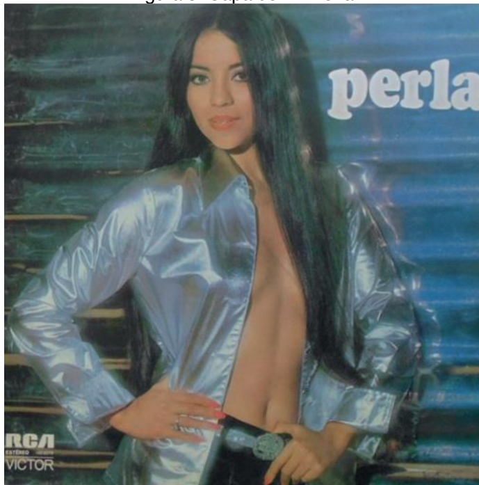
Figura 3. Capa do LP Perla .

A mulher e as relações homem-mulher não foram, entretanto, assunto exclusivo nas canções que tratavam de amor e de sexo. Chico Buarque, acompanhado por Ruy Guerra, já adentrara em 1972 no território das relações homossexuais, apesar de sofrer por isso nas mãos da censura. “Bárbara” 13 , por exemplo, música da peça Calabar, o elogio da traição , tocava às claras nessa questão-tabu, num canto que a unia a Anna de Amsterdam: